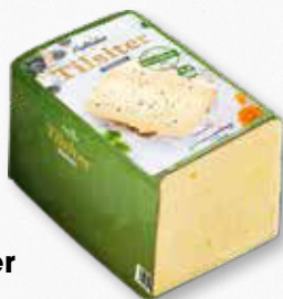
Holtseer Tilsiter deutscher Schnittkäse 45% Fett i. Tr. 100 g