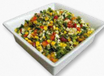
Bunter Käsesalat mit Mais und Lauchzwiebeln, 100 g